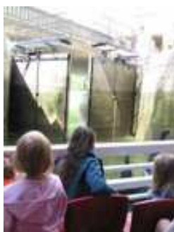
Levez les pieds, l'eau monte !