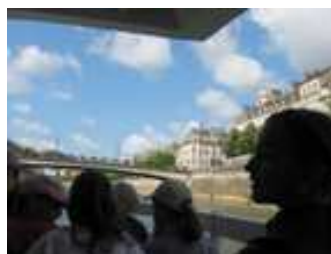
Une vue splendide!