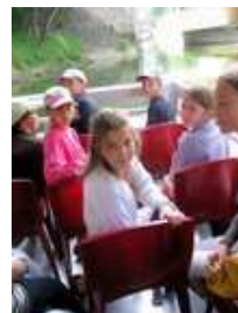
On prend la pose ....