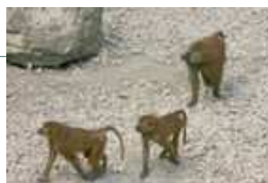
à la queue leu leu !