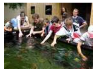
Ça mord ?