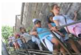
Plus que la descente, et on arrive !